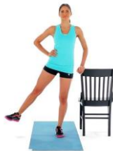
Position initiale/ Ausgangsposition