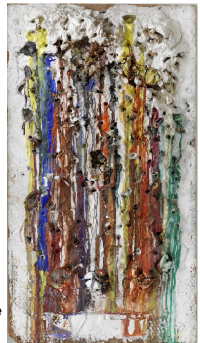
Niki de Saint Phalle, Grand Tir, Séance de la Galerie J , 1961