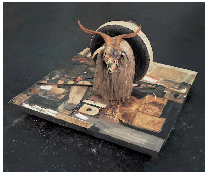
Robert Rauschenberg, Monogramme , 1959