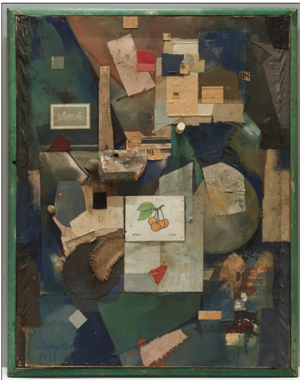
Kurt Schwitters, Image MERZ 32A, l'image cerise , 1921

Depuis la Renaissance jusqu'à la fin du XIXe siècle, la peinture était le genre type dans la conception de l'art. Face à son inviolabilité, les artistes respectaient de nombreuses règles. Cependant au XXe siècle certains artistes essayent de franchir les limites du genre. Situez les artistes cités ci-dessous dans le contexte de l'histoire de l'art. En Vous référant principalement aux oeuvres proposées, montrez comment ces personnalités remettent en question la pratique picturale. Quelles en sont les répercussions sur le développement et la réception de l'art contemporain?