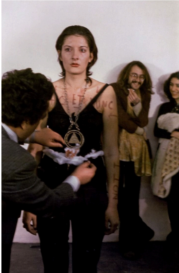
Photographie prise lors de "Rhythm 0" , une performance de l'artiste serbe Marina Abramović qui dura 6 heures et qui a eu lieu au Studio Morra à Naples en 1974.

Erstellen Sie kunstgeschichtliche Verbindungen zwischen beiden Werken im Hinblick auf das Thema « Kunst & Körper ». Präsentieren Sie ihre Ergebnisse auf strukturierte Weise.