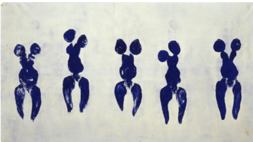
Yves Klein, ANT 82 , 1960