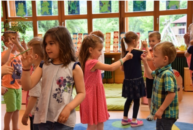
Nommer, cycle 1

L'Institute of Applied Educational Sciences de l'Université du Luxembourg a accompagné et évalué le projet à travers des tests et questionnaires réalisés. Les résultats sont très positifs : les exercices de détente et de relaxation ont été appliqués majoritairement jusqu'à 5 fois ou entre 5 et 10 fois par semaine, ce qui témoigne d'une bonne acceptation à la fois des enseignants et des élèves. Du point de vue des enseignants, les élèves ont bien adhéré au concept.