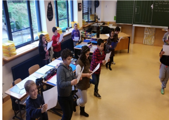
Larochette, cycle 4

Les élèves des écoles participant au projet depuis un an et demi ont répondu à la question: « As-tu aimé participer aux exercices de mouvement? » Le graphique ci-dessous reprend leurs réponses: oui, très volontiers (en vert) / plus ou moins (en orange) / non, pas volontiers (en rouge)