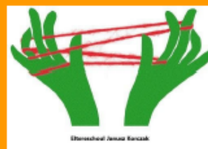
A Kooperation mat